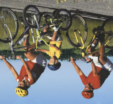
Die Stadtwerke machen das für Sie.